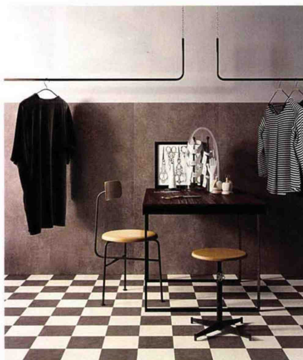
Dalles posées en soubassement, Medley de Supergres. Grand Carpet de Marazzi, pour les murs et les sols, intérieur ou extérieur, grès céramefin coloré dans la masse, 6 mm d'épaisseur.

Les panneaux de faible épaisseur et de grandes dimensions - jusqu'à 1 000 x 3000 mm - se généralisent, multipliant les décors (façon marbre, pierre, surfaces peintes, micromotifs...). Posés au mur, ils offrent, quelle que soit la finition, un rendu lisse (sans joints) très contemporain. Ces panneaux servent à fabriquer des plans de travail ou de toilette, des tables, des crédences, voire des meubles... Coordonnées, les dalles (de 75 x 75 à 120 x 120 cm) habillent les sols, les murs - en soubassement par exemple. Quand elles se font rectangulaires, elles participent à la réalisation de compositions monochromes, avec des poses en quinconce.