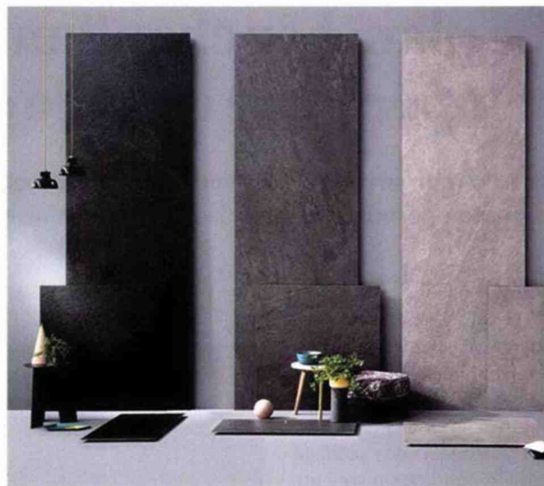
Panneaux XXL muraux et dalles de sol. Waterfall, Lea Ceramiche.