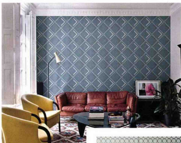
Mélange de styles au sol et au mur, Appiani .

À chaque mur son carrelage ! Le « total look » n'est plus de mise. Les Italiens, qui n'hésitent pas à carrelé même les murs des pièces de vie, donnent des leçons d'inventivité, mêlant motifs, couleurs, formats, textures et autres matériaux. Les murs deviennent des tableaux auxquels les sols répondent. Marier le marbre et le bois sur une même surface, y compris murale, est du plus bel effet. Les dalles carrées ou rectangulaires surplombent des lames d'épaisseurs différentes posées à joints décalés au niveau du soubassement, quand ce n'est pas l'inverse : dalles en soubassement, lames en surplomb. Dans la salle de bains, le mur accueillant les points d'eau s'habille d'un carrelage 3D en vagues voisinant avec les motifs géométriques colorés qui délimitent la douche, tandis que le sol est habillé de marbre ou de terrazzo. Trois modèles pour une ambiance.