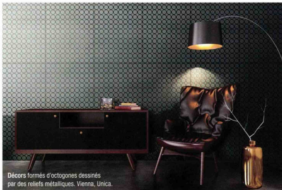
Décor formé d'octogones dessinés par des reliefs métalliques. Vienna, Unica.

Sous l'influence du style carreau de ciment, les décors deviennent graphiques, parfois vintage et typés années 1970. Les carreaux évoquant la marqueterie de pierre, de marbre ou de bois sont légion. Les motifs géométriques (chevrons, losanges, hexagones, ronds...) sont omniprésents. Les carreaux 3D existent, mais ils sont dominés par les vagues.