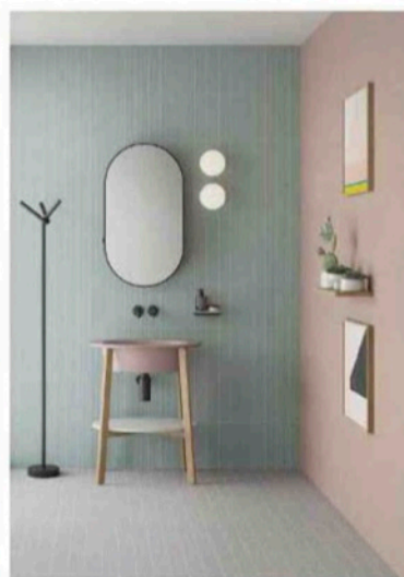
NATO DALLA COLLABORAZIONE TRA APPIANI E FUD, BRAND DEL GRUPPO LOMBARDINIZI, REGOLO GUARDA AL MATERIALE CERAMICO DA UNA PROSPETTIVA NUOVA. IL FORMATO 2.5X30 CM, SPESSORE 7 MM, GARANTISCE MODULARITÀ CON LE COLLEZIONI DI MOSAICO APPIANI, 1.2X1.2 E 2.5X2.5 E 5X10 CM. LA NUOVA PALETTE, CON CROMIE PASSEPARTOUT, È FORMATA DA NOVE TINTE DI CUI TRE NEUTRE E SEI DESATURATE, CALDE E FREDE. OLTRE ALLA VERSIONE FLAT, CON SUPERFICIE PIANA E UNIFORME, È ANCHE TEXTURED CON STRUTTURE A RILIEVO: DOMINO 50 E 100, TATAMI E BAMBOO.