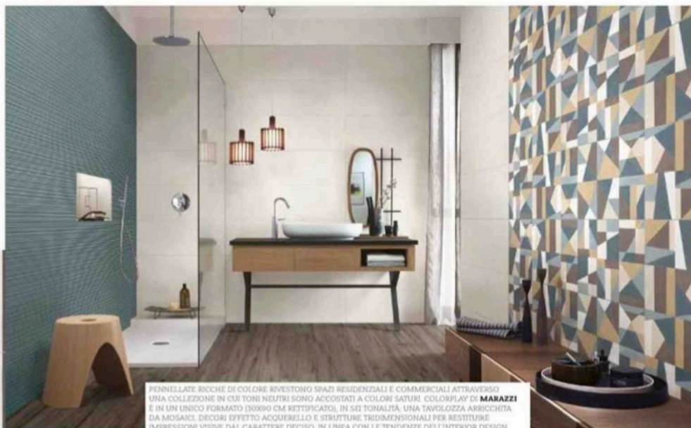
FENNELLE RICCHE DI COLORE RIVESTONO SPAZI RESIDENZIALI E COMMERCIALI ATTRAVERSO UNA COLLEZIONE IN CUI TONI NEUTRI SONO ACCOSTATI A COLORI SATURI. COLORPLAY DI MARAZZI È IN UN UNICO FORMATO (50X90 CM RETTIFICATO), IN SEI TONALITÀ. UNA TAVOLOZZA ARRICCHITA DA MOSAICI, DECORI EFFETTO ACQUERELLO E STRUTTURE TRIDIMENSIONALI PER RESTITUIRE IMPRESSIONI VISIVE DAL CARATTERE DECISO, IN LINEA CON LE TENDENZE DELL'INTERIOR DESIGN.